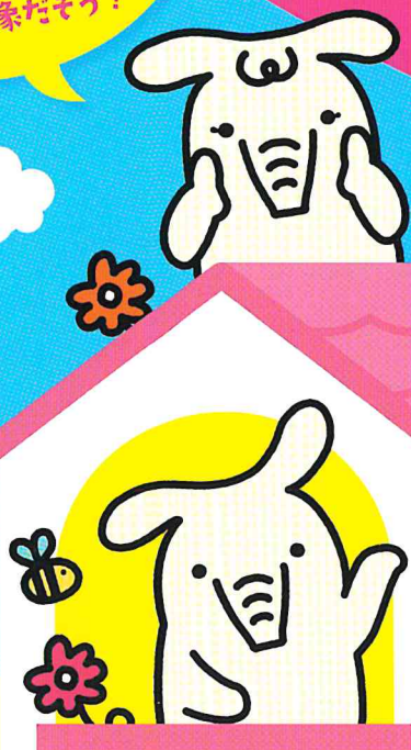
JAバンクキャラクター よりぞう