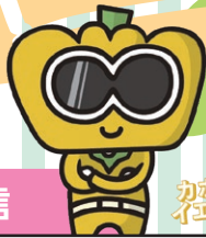
かぼちゃ イエロー!!