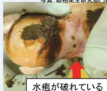
水疱が破れている