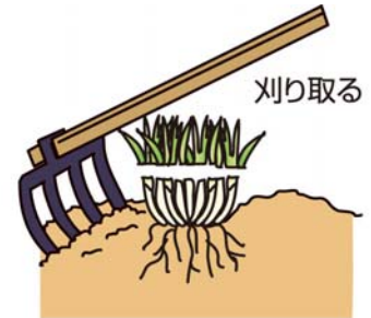
大きくくわを打ち込んで掘り上げる

8月に入るととう立ちし、やがて開花してくるので、一斉に全部刈り取りし、追肥して秋の収穫に備えましょう。