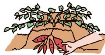
太った芋だけ収穫する