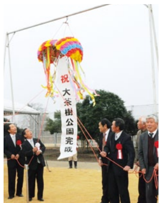
大茶樹をバックにくす玉で公園の完成を祝う関係者

公園内の茶樹は5本あり、大きいもので樹齢100年以上、高さが約45メートルあり、国内でも有数の茶樹といわれています。また、当日は公園内で野点も行われ、出席者にお茶が振舞われるなどしました。霧島市では、大茶樹を霧島茶のシンボルにし、お茶の消費拡大と観光の誘致に役立てたいとしています。