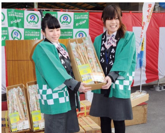
消費地へ届けられる春の食材「あいら新ごぼう」