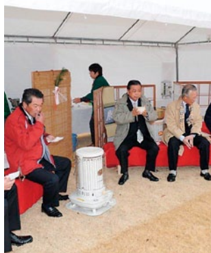
完成した公園内では、野点でお茶も淹られました。