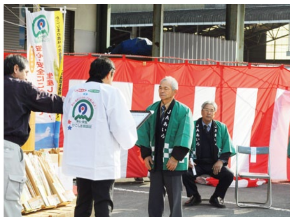
安心・安全へ向けた「かごしまの農林水産物認証」の授与

この後、関係者によるテープカットが行われ、万歳三唱でトラックを見送りしました。 4月上旬まで収穫が続くごぼう部会では、生産者26人で栽培面積12.5ヘクタール、販売数量150トン进行計画しています。