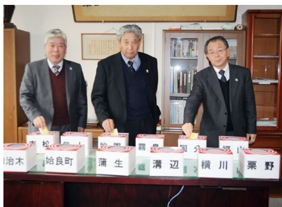
役員の手によって行われた抽選会

平成23年11月1日から12月30日まで行われた「貯王」(ちよきんぐ)と「積王」(つみきんぐ)を対象としたウィンターキャンペーン抽選会が1月11日、隼人町JAあいら本所で行われました。 キャンペーンの抽選は、5千円相当のカタログギフト(特賞)が100名に当たるというものです。