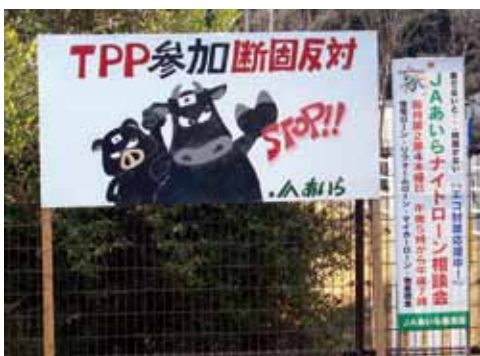
日当山支所前に設置された看板

制作に参加した関係者は「TPPの参加は、日本農業の未来を大きく左右する。看板の設置で反対の機運が高まってくれば」と話しています。