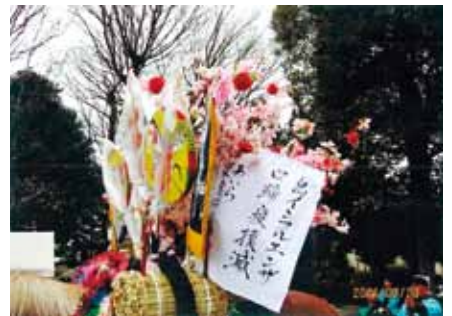
馬の背に飾られた祈願布