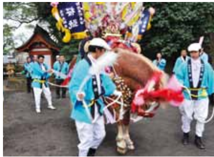
軽快なステップで春の訪れを告げる御神馬