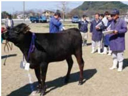
出品牛について丹念に審査を行う審査員

季畜産共進会は管内12会場で開催され、上位入賞牛は4月20日の第20回春季畜産共進会へ出場することになります。